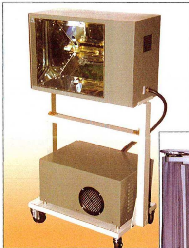
RAPID 5 kW mit Stativ

Das THEIMER-RAPID-SOFORTSTART-SYSTEM ist die kostengünstige Alternative für alle, die kurze Belichtungszeiten bei optimaler Ausleuchtung wünschen.